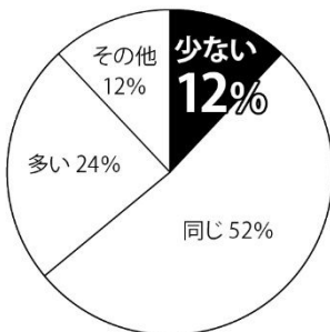
図5 MRワクチンの納入量 (昨年度比較)

MRワクチンの納入状況では「小分けにされ一度の納入量が少ない」が32%、「発注しても納品されない」が14%、「発注後すぐに全量が納入される」は54%だった。会員からは「子どもの定期接種分をなんとか確保している状況、大人の接種は申し訳ないが断らざるをえない」など、風疹の流行をくいとめるために必要な、大人への接種ができない状況を危惧する声が寄せられた。