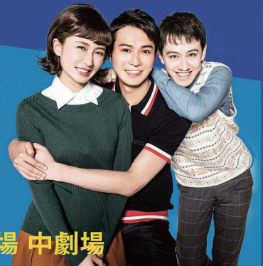
【オープニングシーン 1973～1976】