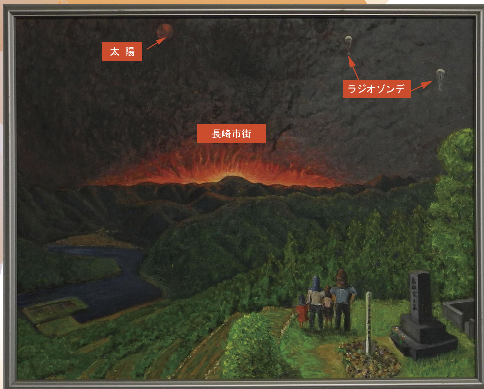
被爆体験者が記憶をもとに描いた絵。旧戸石村より長崎市街を望む。

長崎原爆が投下されると爆心地に巨大な原子雲が発生し、同心円状に広がりながら風速3mの西風によって東方へ流れました。