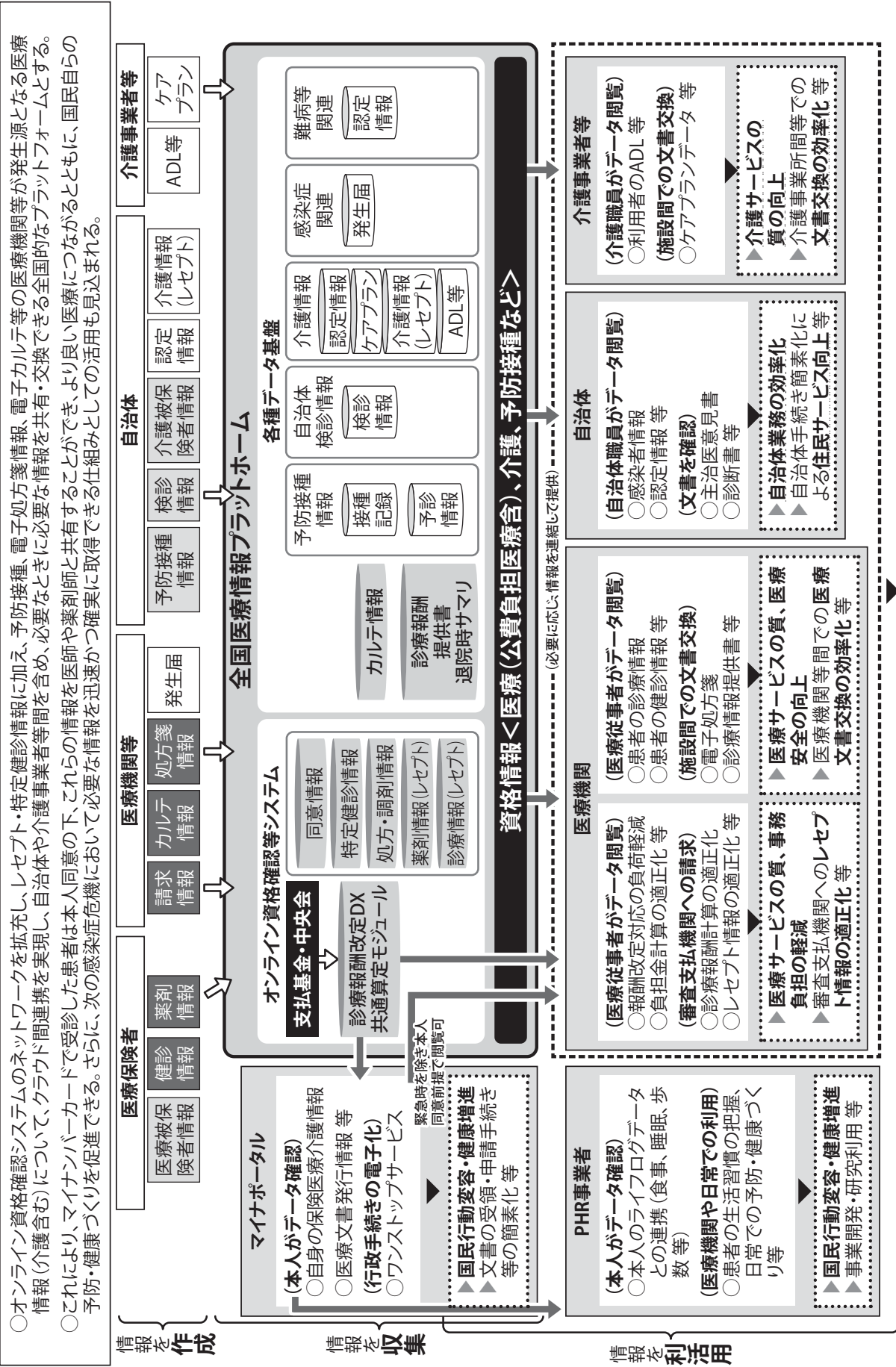
「全国医療情報プラットフォーム」(将来像)