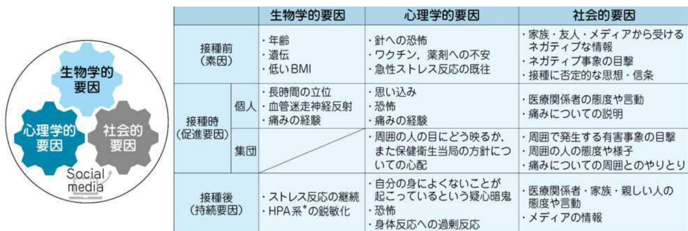
図表4 予防接種とバイオサイコソーシャルモデル

*HPA系：hypothalamic-pituitary-adrenal axis 視床下部-下垂体-副腎系