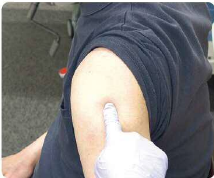
図表6 穿刺部位の確認

◇安全な理由は、三角筋の中央部には重要な神経や血管の走行がないためです。ここに正確に接種された場合、痛みは最小限で出血することもほとんどありません。